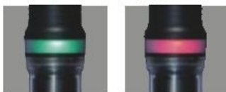
Leuchtet grün auf bei OK-Verschraubung